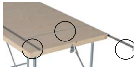
Linjal, måttgradering och avskärsskena