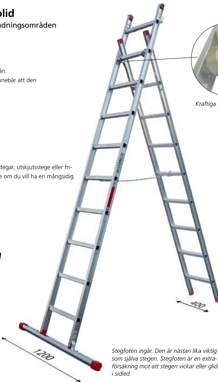
Kraftiga och säkra beslag.

Stegfoten ingår. Den är nästan lika viktig som själva stegen. Stegfoten är en extra-försäkring mot att stegen vickar eller glider i sidled.